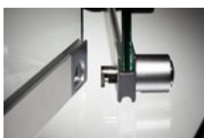
slot met behuizing