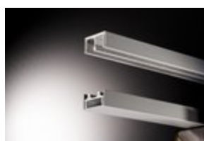
boven en onder