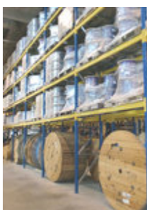
Staalimex palletstelling Amersfoort