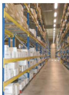
Staalimex palletstelling Amersfoort