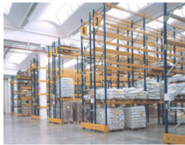
Staalimex palletstelling Italië