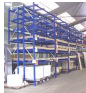
Staalimex palletstelling Bergambacht