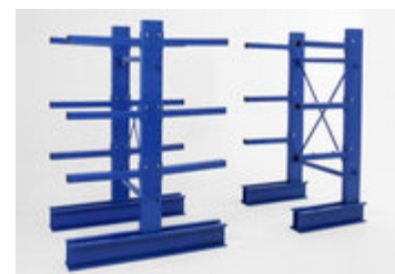
Staalimex draagarmstelling licht